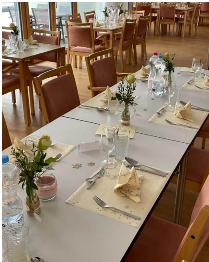
Alles ist bereit und festlich geschmückt