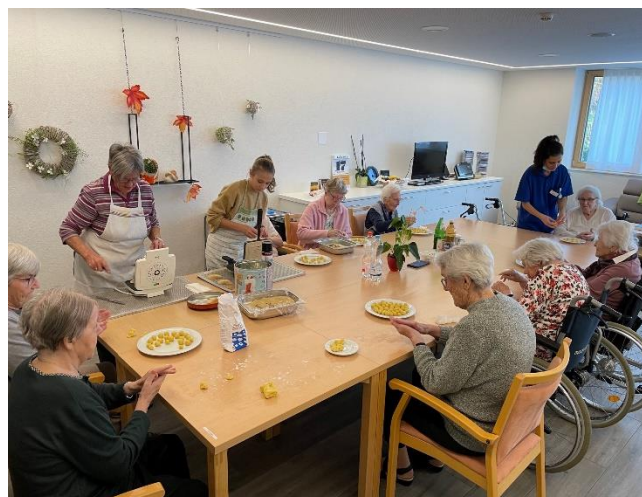
Alle sind mit vollem Elan dabei!