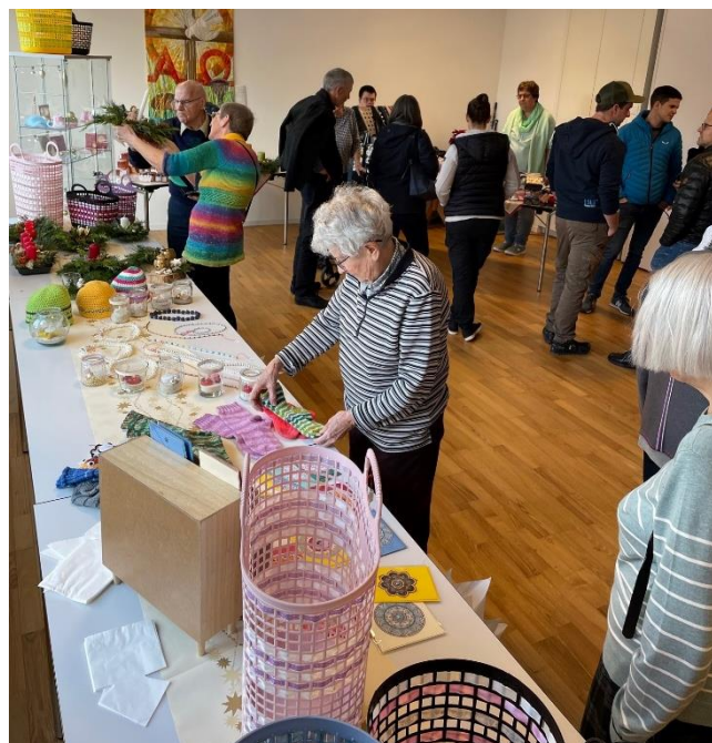
Verschiedenste Aktivitäten fanden während der Adventszeit statt