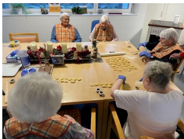
Bretzelbacken im Sântis