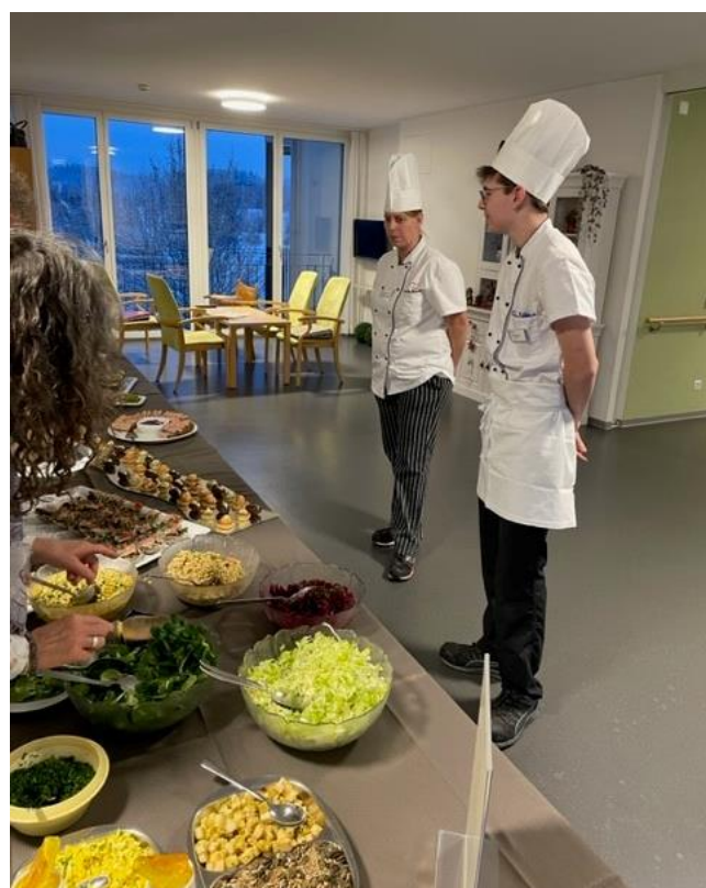
Wer kann bei dieser Auswahl widerstehen?