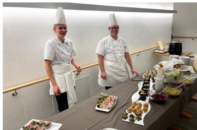
Das Küchenteam freut sich darauf die Gäste zu verwöhnen