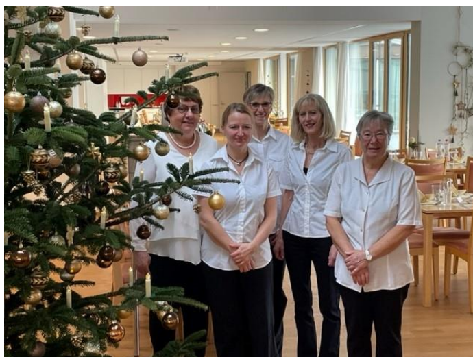
Die guten Feen stehen bereit